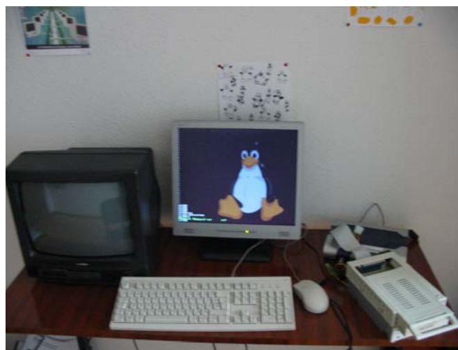
Mode Frame Buffer de la plateforme OM-Cube