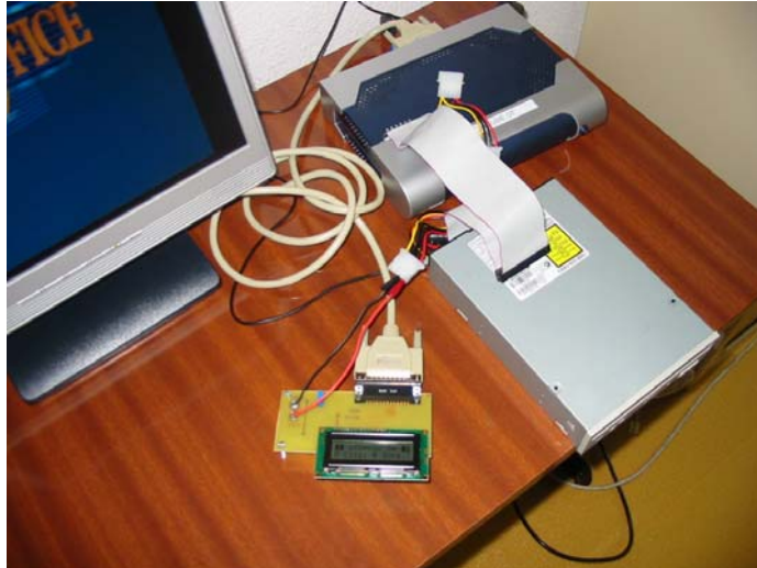
Afficheur LCD du projet OM-Cube