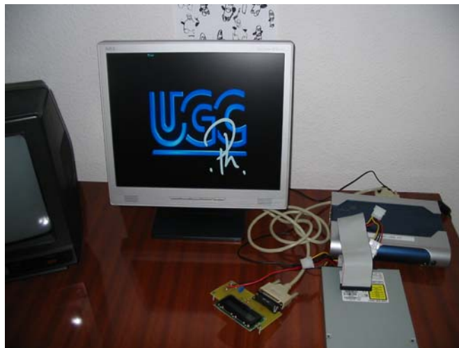
Lecture d'un DVD avec la plateforme OM-Cube. Affichage sur écran LCD