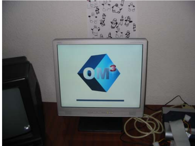
Ecran de boot splash au boot de la plateforme OM-Cube