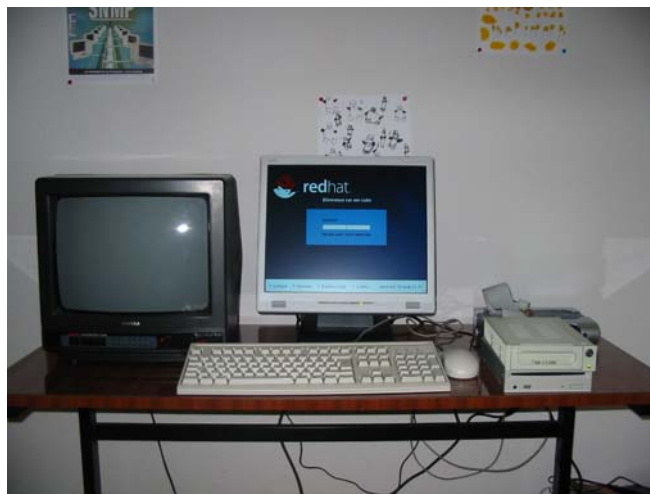
Plateforme de développement OM-Cube